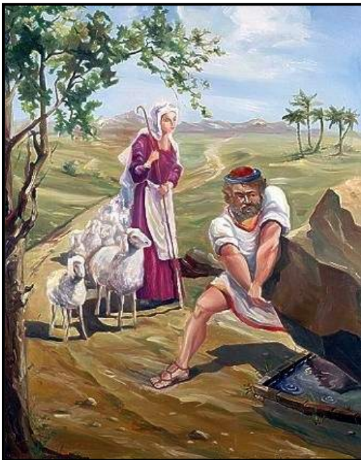
יעקב מגולל את האבן מעל הבאר

פסוקים 9 - 12 - "עוֹדְנוּ מְדַבֵּר עִמָּם וְרָחֵל בָּאָה עִם-הַצֹּאן אֲשֶׁר לְאִבְיָהּ כִּי רָעָה הוּא. וַיְהִי כַּאֲשֶׁר רָאָה יַעֲקֹב אֶת-רָחֵל בֵּת-לָבָן אַחֵי אִמּוֹ וְאֶת-צֹאן לָבָן אַחֵי אִמּוֹ וַיִּגֶשׁ יַעֲקֹב וַיִּגַּל אֶת-הָאֶבֶן מֵעַל פִּי הַבָּאָר וַיִּשְׁק אֶת-צֹאן לָבָן אַחֵי אִמּוֹ. וַיִּשְׁק יַעֲקֹב לְרָחֵל וַיִּשָּׂא אֶת-קָלוֹ וַיִּבְדֵּךְ. וַיִּגַּד יַעֲקֹב לְרָחֵל כִּי אַחֵי אִבְיָהּ הוּא וְכִי בֶן-רִבְקָה הוּא וַתִּרְצַח וַתִּגַּד לְאִבְיָהּ."