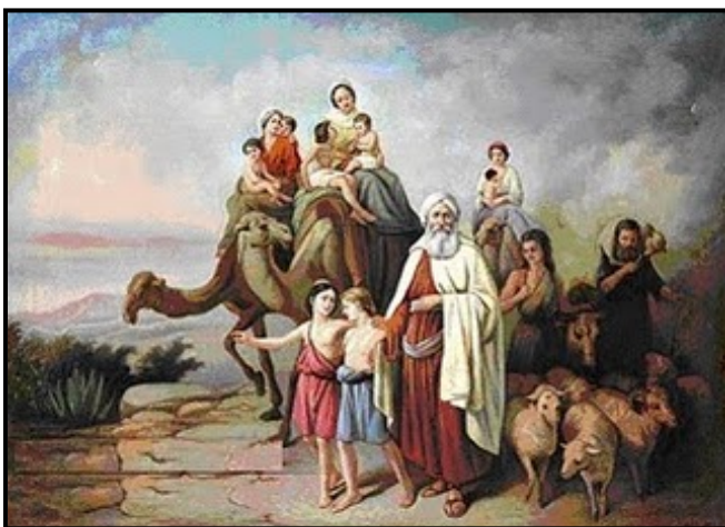
אברהם בדרכו לארץ כנען

פסוקים 4 - 5 - "וַיֵּלֶךְ אַבְרָם כְּאִשֶּׁר דָּבַר אֱלֹהֵי יְהוָה וַיֵּלֶךְ אִתּוֹ לוֹט וְאַבְרָם בֶּן-חָמֵשׁ שָׁנִים וְשִׁבְעִים שָׁנָה בְּצֵאתוֹ מִחָרָן. וַיִּקַּח אַבְרָם אֶת-שָׂרִי אִשְׁתּוֹ וְאֶת-לוֹט בֶּן-אָחִיו וְאֶת-כָּל-רְכוּשָׁם אֲשֶׁר רָכְשׁוּ וְאֶת-הַנֶּפֶשׁ אֲשֶׁר-עָשׂוּ בְּחָרָן וַיֵּצְאוּ לְלֶכֶת אֶרְצָה כְּנַעַן וַיָּבֹאוּ אֶרְצָה כְּנַעַן".