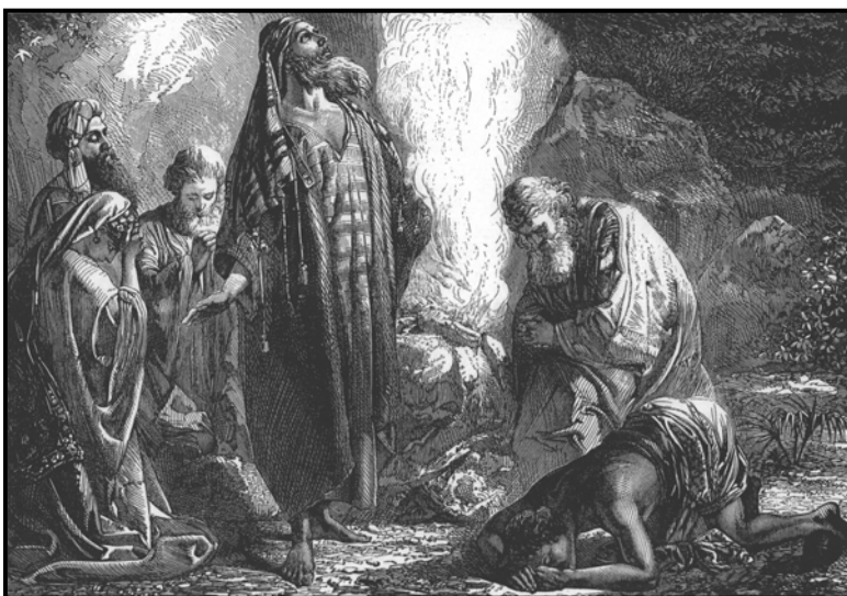
איוב קורע את בגדיו ומתפלל לאלוהים

פסוקים 20 - 22 - "וַיִּקַּם אִיּוֹב וַיִּקְרַע אֶת מְעָלוֹ וַיִּגְזֵ אֶת רֹאשׁוֹ וַיִּפֹּל אַרְצָה