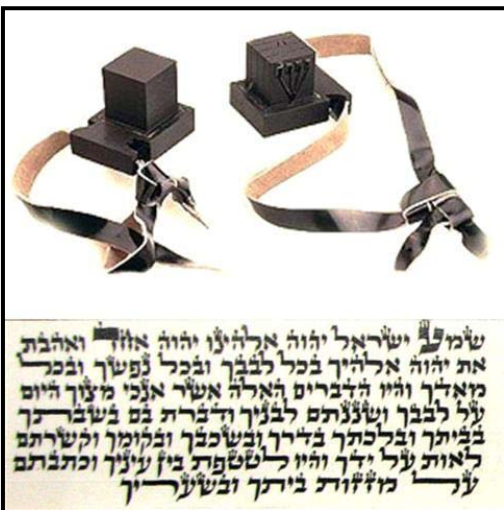
זוג תפילין לראש וליד

פסוק 8 - "וּקְשַׁרְתָּם לְאוֹת עַל-יָדְךָ וְהָיוּ לְטֹטְפוֹת בֵּין עֵינֶיךָ."