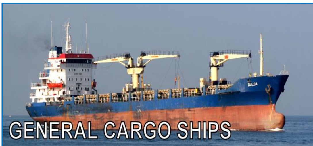
אוניית מטען כללי

זאת אוניה ללא התאמה ספציפית, שמובילה סוגי מטען שונים כמו: משטחים, חביות, שקים, קרטונים, ארגזים ואף מטענים חריגים. המטען מועמס על האוניה בהתאם לצורת אריזתו: ביחידת אריזה בודדת (ארגזים, קרטונים, חביות וכדומה) או באריזה אחידה (משטחים וכד'). בהובלה מסוג זה יש לשים לב לאיכות האריזה, שכן המטען חשוף לנזקים בזמן הטעינה והפריקה, ומחייב אריזה שתעמוד בטלטולי הדרך. הטענתן ופריקתן של אוניות כאלה היא, ממושכת למדי ועתירת כוח אדם, והן האחרונות לתפעול בנמל הפריקה. לפיכך הן מתעכבות בנמלים זמן רב, וזה עלול לגרום לאיחור בהגעת הסחורה ליעדה.