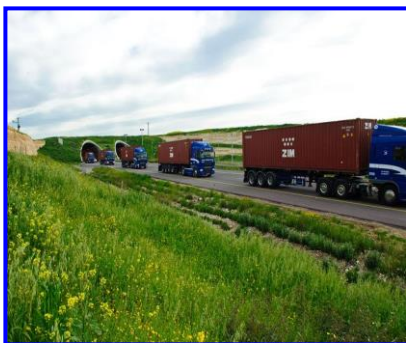
הובלה יבשתית הובלה דרך היבשה