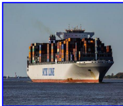
הובלה ימית הובלה דרך הים