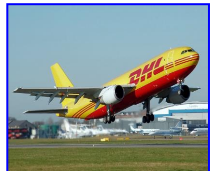
הובלה אווירית הובלה דרך האוויר

מובילי המטענים, נושאים עימם מסמכים המציינים את מאפייני המטען, הכמות שלו, פרטי השולח, פרטי המקבל ועוד. למסמכים אלו קוראים: שטר מטען .