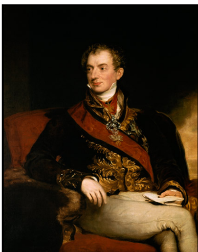
קלמנס פון מטרניך ראש ממשלת אוסטריה