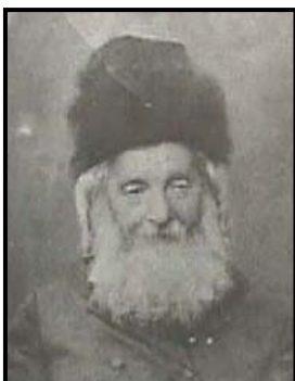
הרב שמואל מוהליבר

הרב נפתלי יהודה צבי ברלין (1817 - 1893) ראש ישיבת וולוז'ין ו ישיבת עץ החיים שקרא לעלייה והתיישבות בארץ ישראל. אך רוב הרבנים מהיהדות הדתית מסורתית נמנעו והתנגדו לפעילות הזו.