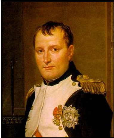
נפוליאון קיסר צרפת

בשנת 1804 הוכתר נפוליאון לקיסר צרפת, ובתקופת שלטונו דעכו הישגיה של