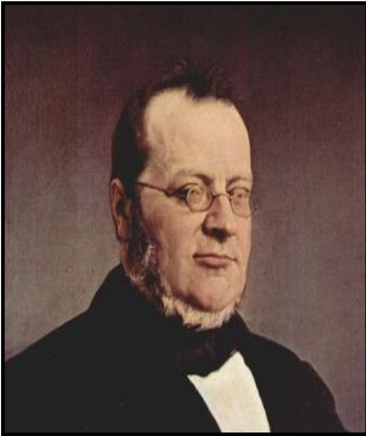
קמילו קאבור ראש הממשלה הראשון של איטליה

כישלון של מהפכות "אביב העמים" הביא לאובדן אופייה הליברלי של הלאומיות האירופית, ובמחצית השנייה של המאה ה-19 החלו להתגלות תופעות של אלימות כלפי עמים אחרים.