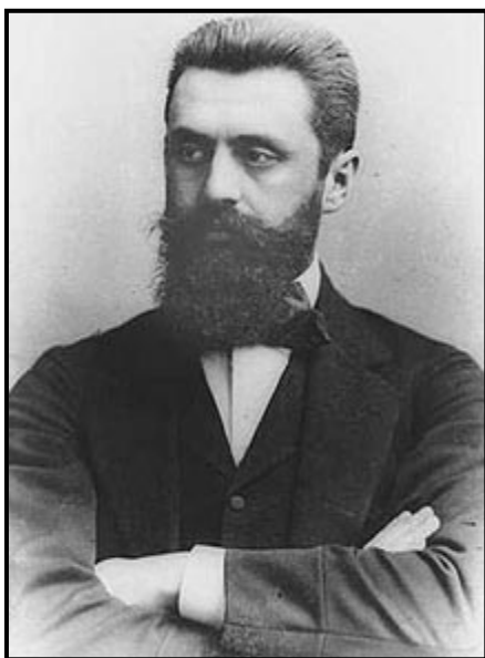
בנימין זאב הרצל

הרצל נולד בשנת 1860 בבודפשט שבהונגריה, למשפחה יהודית מתבוללת והתחנך בסביבה של מתחים לאומיים. בהיותו בן 18, עקרה המשפחה לווינה בירת הקיסרות האוסטרו הונגרית, שם החל בלימודי המשפטים, אותם סיים בתואר דוקטור. למשך זמן קצר עסק בעריכת דין, אולם החליט להקדיש עצמו לכתיבה ועיתונאות.