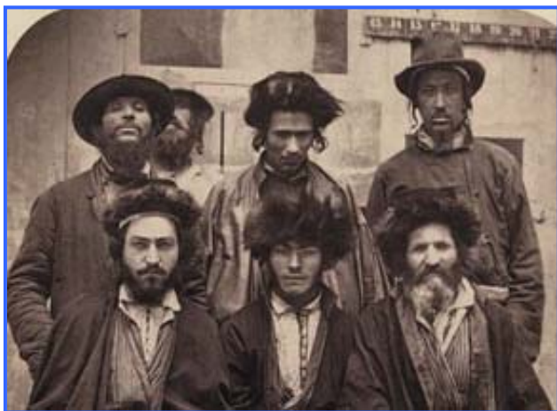
אנשי היישוב הישן

בשנת 1881 האוכלוסייה בארץ ישראל היתה דלילה ושלטה בה האימפריה העות'מאנית. האוכלוסייה היהודית שכללה כ 25000 נפש וכונתה היישוב הישן התרכזה בעיקר בערי הקודש ירושלים, צפת, טבריה וחברון, לצד שכניהם