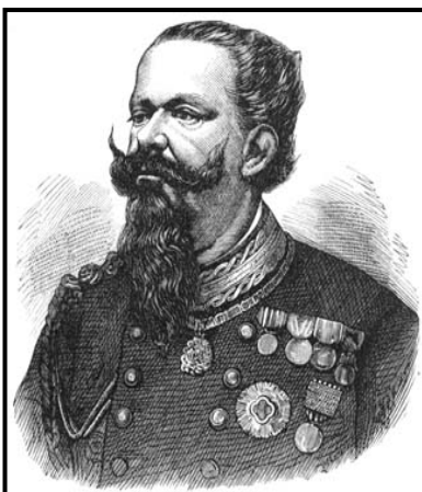
ויטוריו עמנואלה ה-2 מלך פיימונטה ומלך איטליה

קאבור כרת ברית עם נפוליאון ה-3 קיסר צרפת שגם הוא לא היה מעוניין באיחודה של איטליה כמדינה חזקה לצד צרפת. אך, הבטחתו של קאבור להקים באיטליה פדרציה שתמנע הקמת מדינה חזקה, הביאה לשיתוף פעולה עם הצרפתים, ולסילוק האוסטרים בשנת 1858 מרוב שטחי צפון איטליה, ואיחודם תחת מלך פיימונטה. בשנת 1860 הצטרף למאבק הלאומי הגנרל ג'וזפה